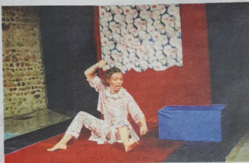
Un décor simple, une chorégraphie et une gestuelle précises, pour un spectacle très touchant.

Les réactions du public ne se font pas attendre : petits et