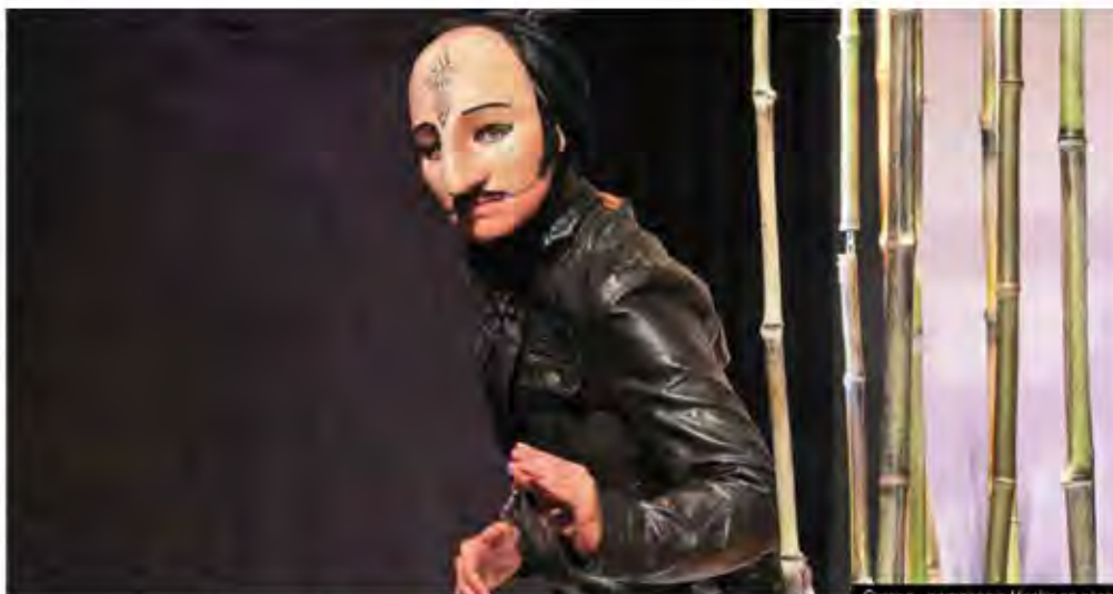
Cyrano - compagnie Hecho en casa