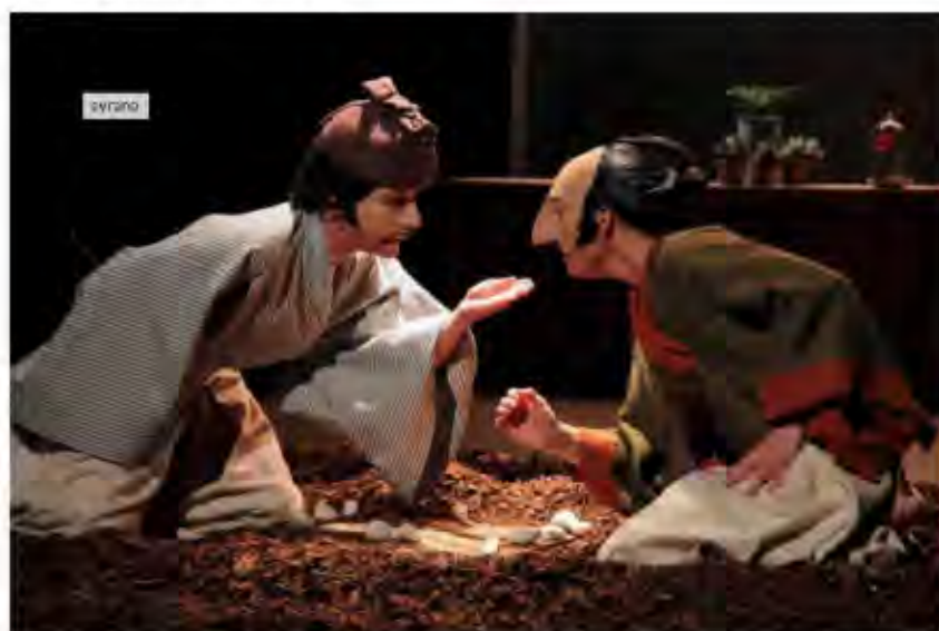
Caché dans son buisson de lavande, Cyrano sentait bon la lessive, spectacle de la Cie Hecho en Casa.

Les Lucioles à 20h40 jusqu'au 29 juillet