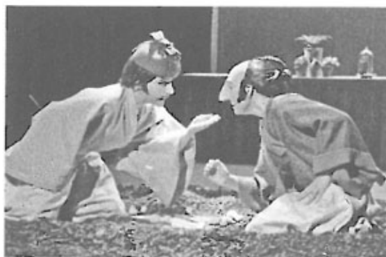
«Caché dans son buisson de lavande Cyrano sentait bon la lessive» © Guy Labadens

Le Cyrano de Rostand plane parmi les grandes ombres étincelantes de la littérature. C'est ce Gascon au grand cœur, ce poète au grand nez, que l'illustratrice Rebecca Dautremier a 'croqué' ; ce Cyrano-là est unique, revivifié par la plume de Tai-Marc Le Thanh, qui restitue l'essentiel de la fable et la beauté de ce grand poème d'amour.