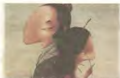
Lecture théâtralisée le mercredi 8.

C'est ce qui sera proposé à Urrugne ce mercredi grâce à la compagnie de théâtre "Hecho en Casa" qui viendra réaliser une lecture théâtralisée du conte Cyrano de Taï-Marc Le Thanh (avec les belles illustrations de Rebecca Dau-tremer) qui a repris le grand classique d'Edmond Rostand pour l'adapté aux