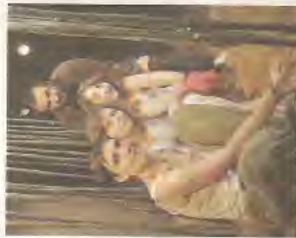
Cyrano et Roxane à la mode japonaise.