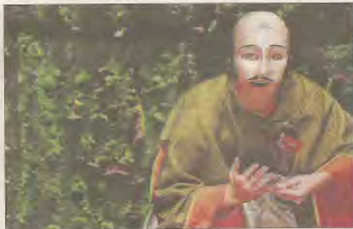
Une lecture théâtrale de « Cyrano ».

Sur un territoire aussi vaste que la Basse-Navarre, nous essayons de diffuser des spectacles pluridiscipli-