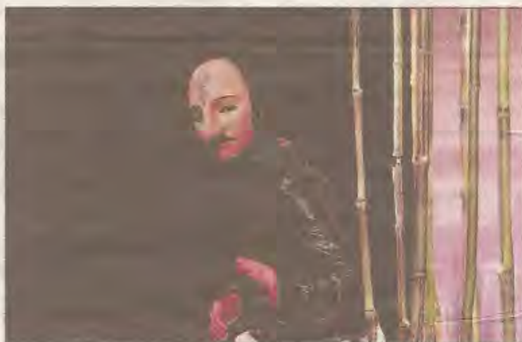
La compagnie Hecho en casa livre un Cyrano japonisant.

Ces propositions attirent de nombreuses classes venant de Biarritz, mais aussi de communes environnantes ou lointaines comme Cambo ou Labenne. L'engouement s'explique aussi par les efforts des compagnies pour assurer le « ser-