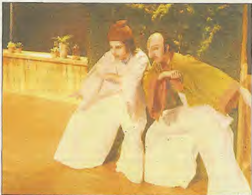
Les comédiennes en répétitions à Lutxiborda interpréteront les trois personnages principaux, Cyrano, Christian et Roxane.

Comme tout spectacle qui nécessite une fabrication et des répétitions, la Scène de Pays Baxe Nafarroa, qui est une des coproductions du spectacle, nous a invités en résidence pendant quinze jours à Lutxiborda. Une résidence, c'est une mise à disposition d'une salle de répétitions avec des moyens techniques, ainsi que le logement et les repas pris en charge par la structure d'accueil, qui permet à la compagnie d'être en immersion sur la durée et d'intensifier ses ré-