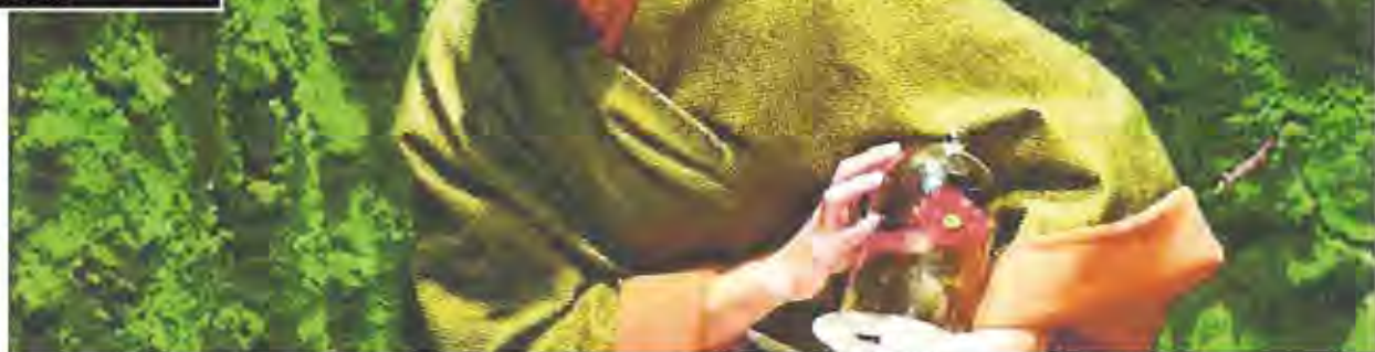
Cyrano, même en samouraï, garde le même cap ! &gt;&gt;&gt; HOTO DU COMPAGNE HECHO EN CASA